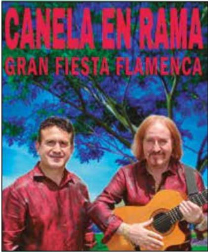
CANELA EN RAMA GRAN FIESTA FLAMENCA