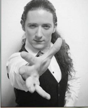
Grupo de Baile Al compás