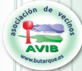
asociación de vecinos AVIB www.butarque.es

Escenario Central en el Cerro de los Ángeles