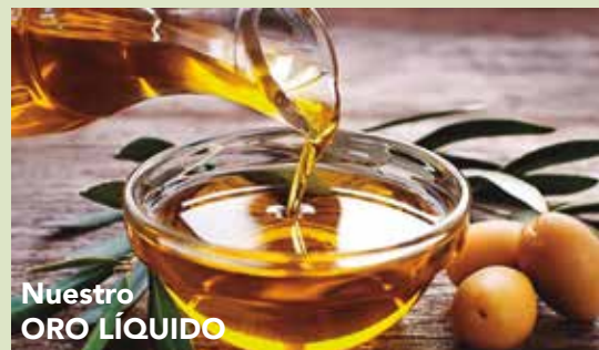
Nuestro ORO LÍQUIDO

Dos nombres gráficos y curiosos han traído la brava serranía de Jaén al léxico culinario español: el ajo de la mano y el ajo harina. El ajo de la mano es un preparadillo de patatas mientras que el ajo harina es un grato guiso de bacalao con patata, que ofrece una salsa bastante espesa.