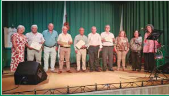
Homenaje a los Socios que Cumplen 80 años en 2024